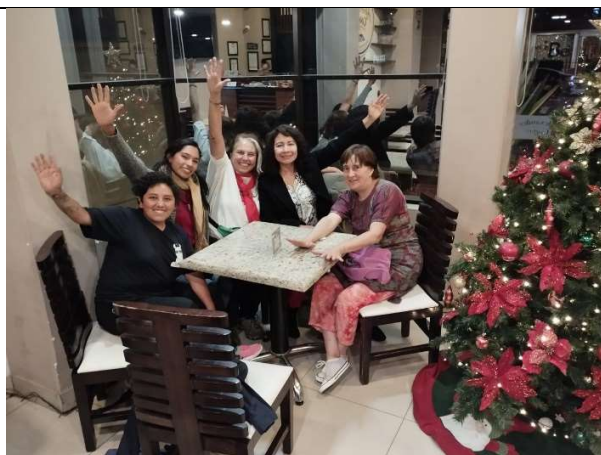
Steering Committee, La Paz, Bolivia Martes 12 de diciembre.