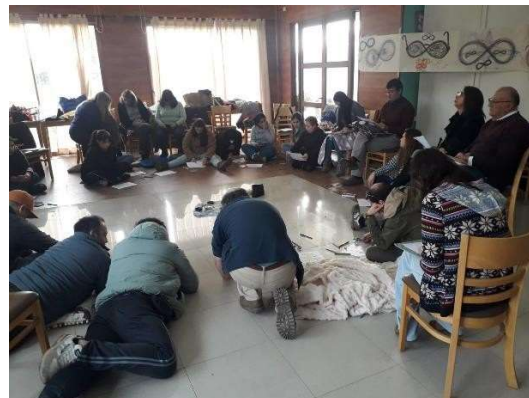
Equipo Diplomado 7P

Agosto a Noviembre: Realización Diplomado Internacional en Educación en 7 Pétalos